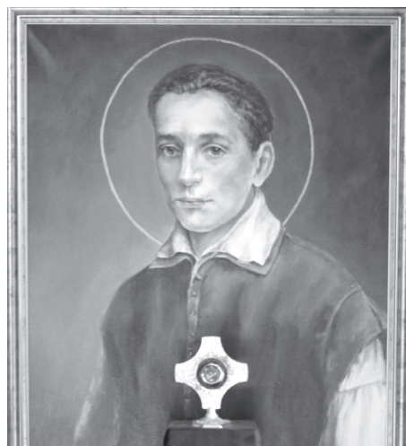
Obraz i relikwie św. Stanisława Kostki