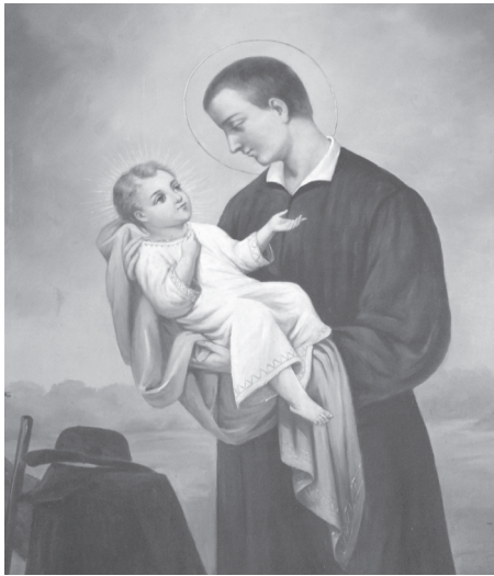
Św. Stanisław Kostka z Dzieciątkiem Jezus

do celu otrzymał łaskę przyjęcia Komunii świętej z rąk anioła, kiedy wstąpił do protestanckiego kościoła w przekonaniu, że jest to kościół katolicki. Jednak Augsburgu nie zastał przełożonego, zatem wyruszył dalej do Dylingi, gdzie Jezuici mieli swoje kolegium. Tam też Stanisław został przyjęty na próbę. Przydzielono go do służby u konwiktorów. Sprzątał ich pokoje i pomagał im w kuchni.